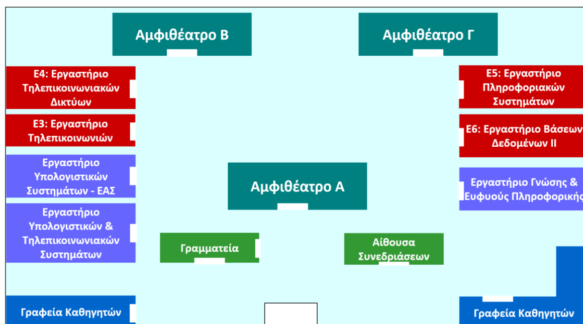
Σχήμα 1 Κεντρικό κτήριο τμήματος Πληροφορικής και Τηλεπικοινωνιών

Στο Σχήμα 1 φαίνεται η κάτοψη του Κεντρικού κτηρίου του τμήματος Πληροφορικής και Τηλεπικοινωνιών με τα αμφιθέατρα και τα εργαστήρια τα οποία διαθέτει.